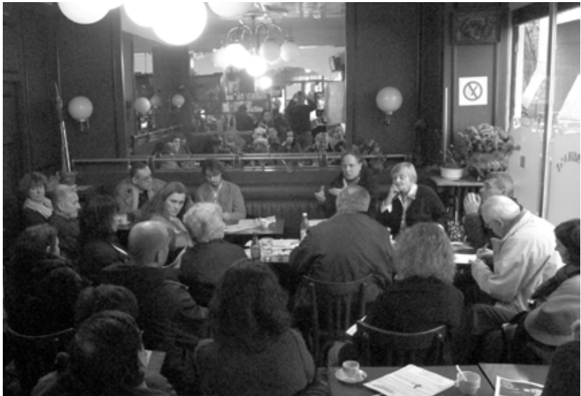
Discuter peut aussi donner lieu à une construction collective qui n'existerait pas sans cette discussion.

de ce qu'elle déplace de sa position initiale, etc. (...) Discuter peut donc bien entraîner un enrichissement de la pensée de chaque individu dans un groupe, à cause de la dynamique des interactions. » Discuter peut aussi donner lieu à une construction collective qui n'existerait pas sans cette discussion. Ainsi, dans le café philo, « une idée en appelle une autre qui amène un désaccord qui s'argumente puis déplace la façon de traiter le sujet, ou le besoin de bien savoir de quoi l'on parle amène à définir une notion qui amène une discussion sur son approche, une distinction d'avec une autre, etc. » Et si, à première vue, un certain désordre semble dominer dans la suite des interventions, il existe souvent une « cohérence profonde, et ce d'autant plus que l'animateur garde à l'esprit, notamment dans ses reformulations, la question que l'on traite, et sache faire les liens assurant une certaine progression du débat ».