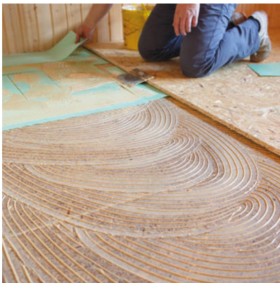
Étendre la colle