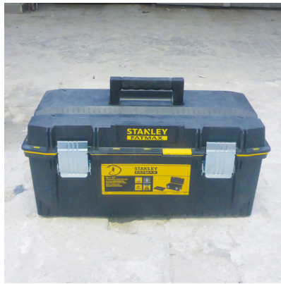
Une boîte à outils