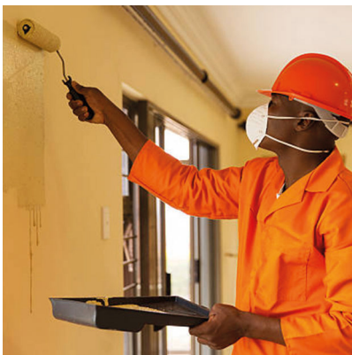
Peindre sur des surfaces