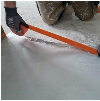
Protéger le chantier