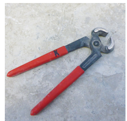
Une pince coupante