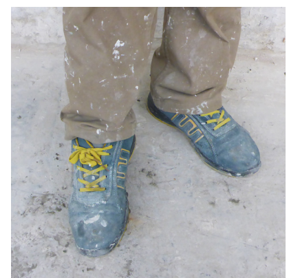
Des chaussures de sécurité

La liste du matériel n'est pas complète, il existe d'autres outils que vous découvrirez lors de votre formation.