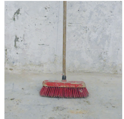
Un balai brosse