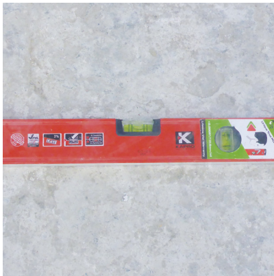
Un niveau bulle