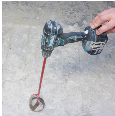
Un mélangeur sur visseuse