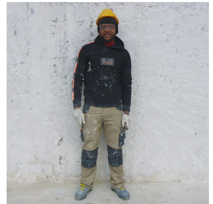
Équipements de protection