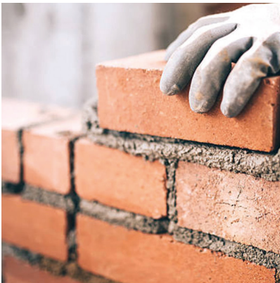
Monter un mur