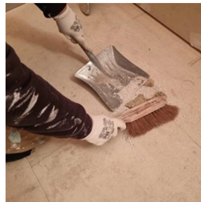
Nettoyer le chantier