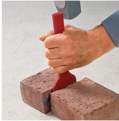
Couper une brique (ou couper du carrelage)