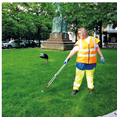
Ramasser les papiers avec une pince crocodile sur les pelouses