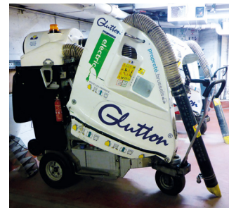
Un « Glutton »