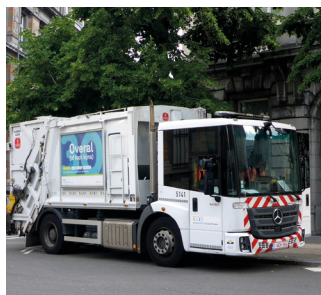
Un camion benne à ordure