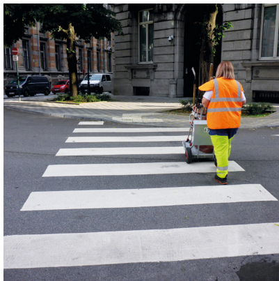
Aller sur sa zone de travail