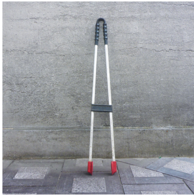
Une pince crocodile