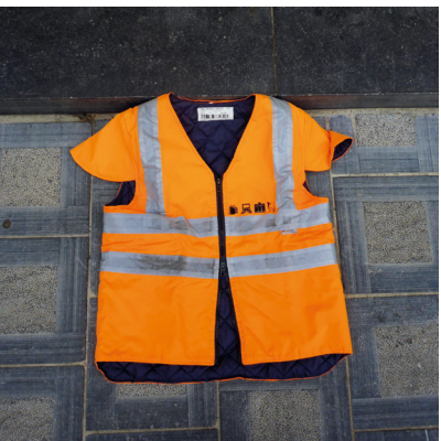
Un gilet fluorescent