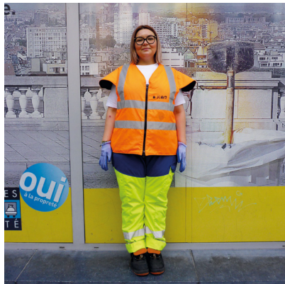
Porter une tenue de travail