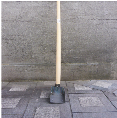
Une pelle à avaloir