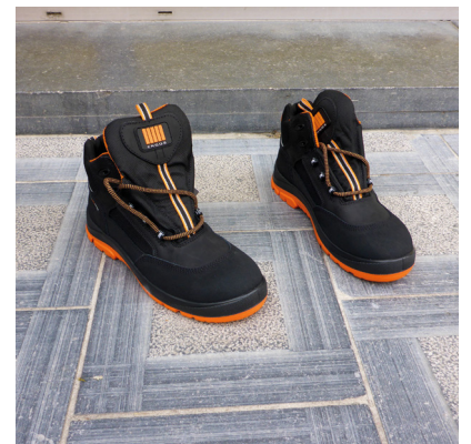
Des chaussures de sécurité