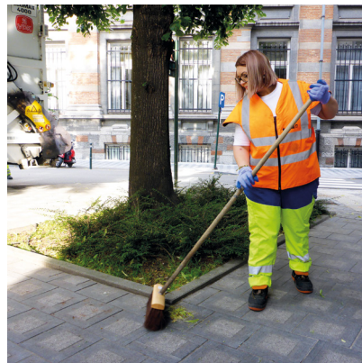
Balayer les trottoirs