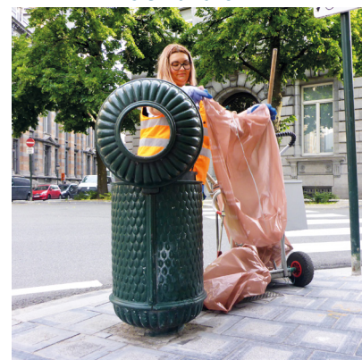
Vider la corbeille