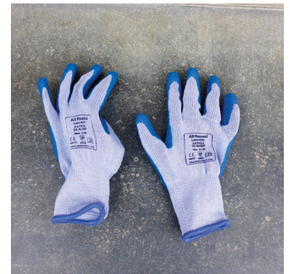
Des gants de protection