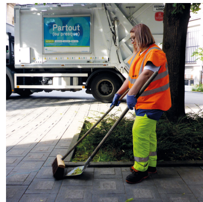
Ramasser les feuilles