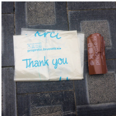
Des sacs poubelles