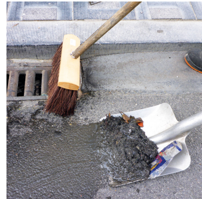
Ramasser les déchets de l'avaloir