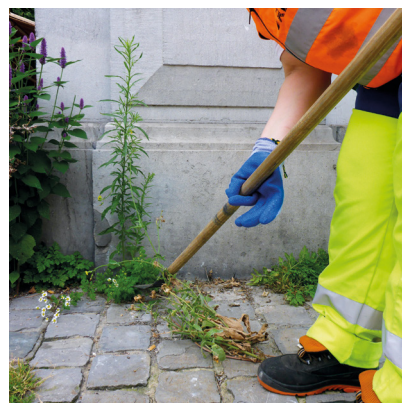
Désherber les mauvaises herbes