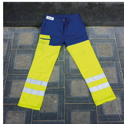
Un pantalon fluorescent