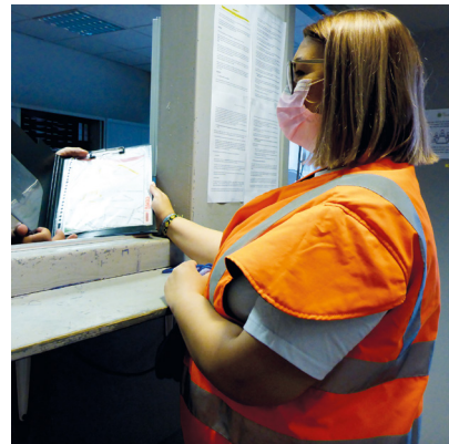
Suivre les consignes