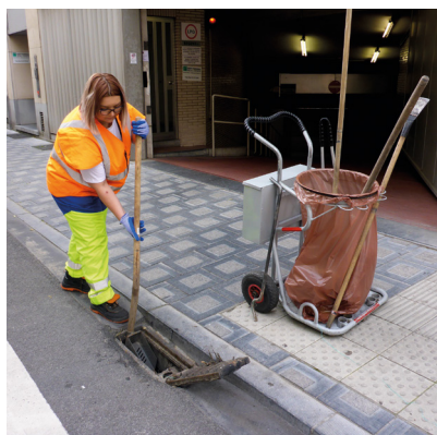
Ouvrir un avaloir