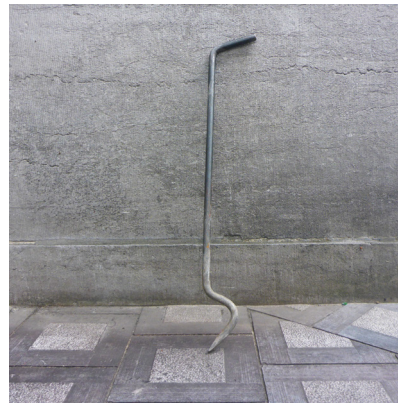
Un crochet à avaloir